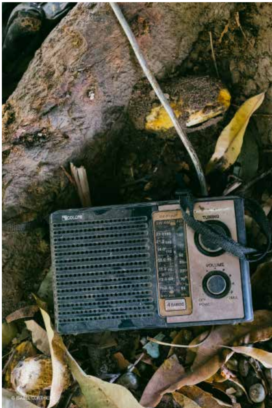
BOVEN - De radio waarmee de jonge mannen hun werkdag opvrolijken.